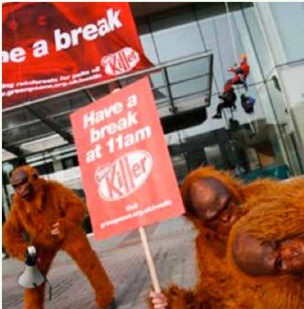
Protesta contra la deforestación en la cadena de suministro de Nestlé

Una importante causa del cambio en muchos países, y de parte del Plan de Acción FLEGT de la UE en Europa, fue la introducción de políticas gubernamentales sobre la compra de madera procedente del aprovechamiento legal y sostenible. Como las compras de la administración pública representan hasta el 20 % de todas las compras directas y las normas gubernamentales a menudo tienen un gran impacto indirecto, este giro en la política creó un mercado para las empresas que podían cumplir los nuevos requisitos del Gobierno y un riesgo para las que no podían hacerlo. Ahora empiezan a surgir políticas similares en materia de deforestación, como se ha visto en los Países Bajos y el Reino Unido.