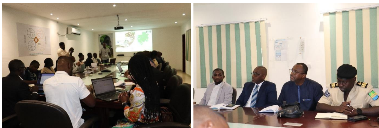
Session de Brainstorming au WWF Gabon